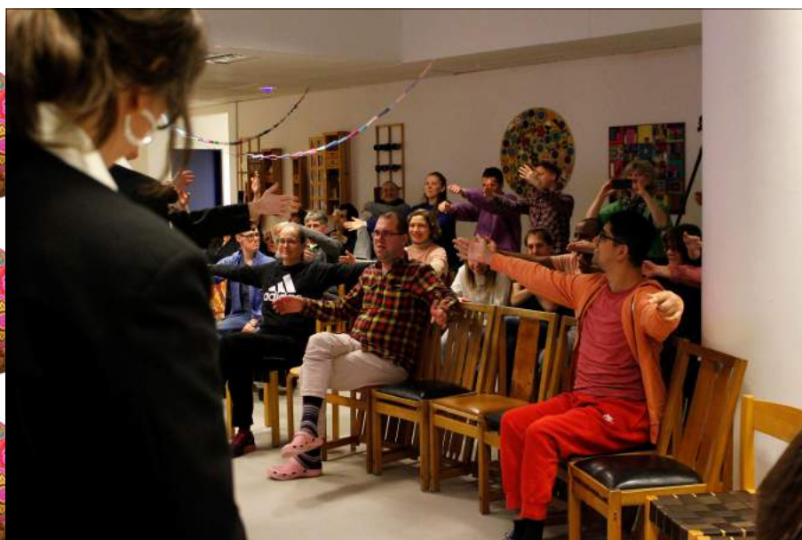
Vi avslutade med att ge världen en stor kram.