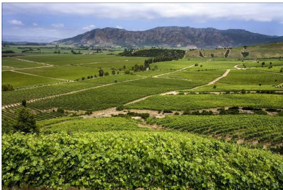
Man odlar mycket vin utanför Curico.