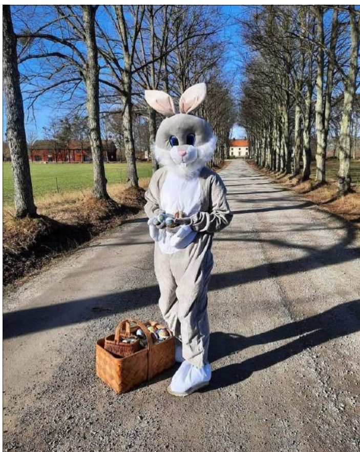
Påskhare på landet.