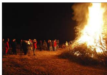
Påskeld i Holland.