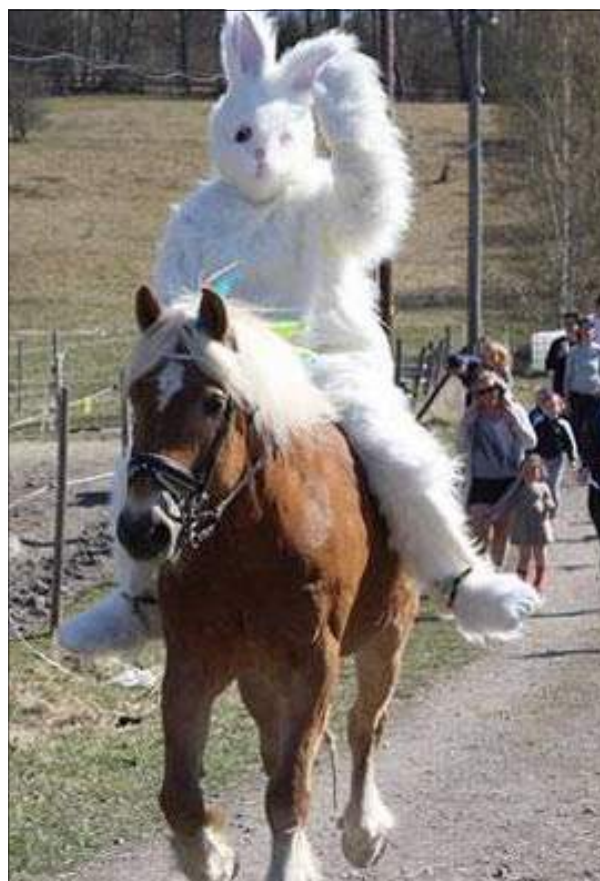
Ridande påskhare till häst.