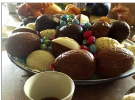
Chokladägg i Belgien.

Det är många fina parader och Miss Songkran ska krönas.