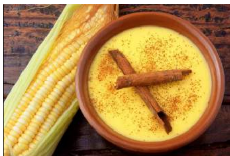
Min favoritmat i Chile.