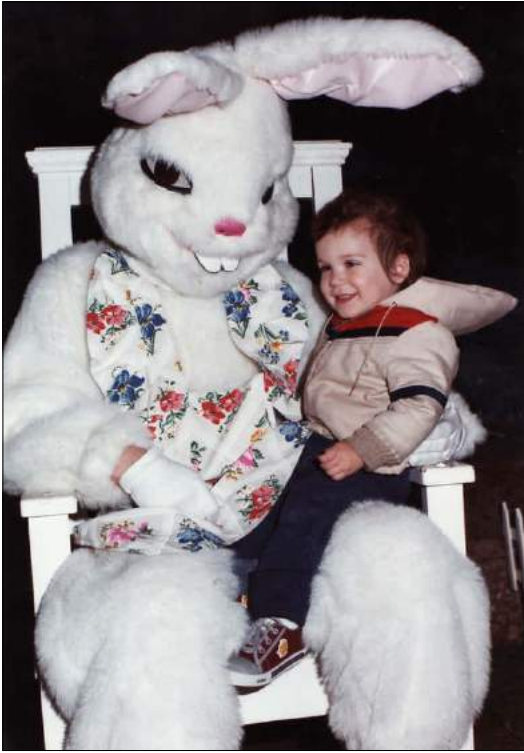
Påskhare med barn.