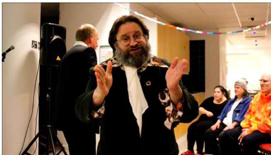
Skådespelarna var duktiga.