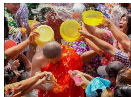
Vattenfestival i Thailand.