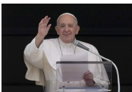
Välsignade av påven.