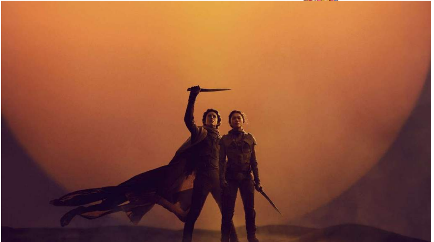
Paul Astreides och Chani i Dune part 2.