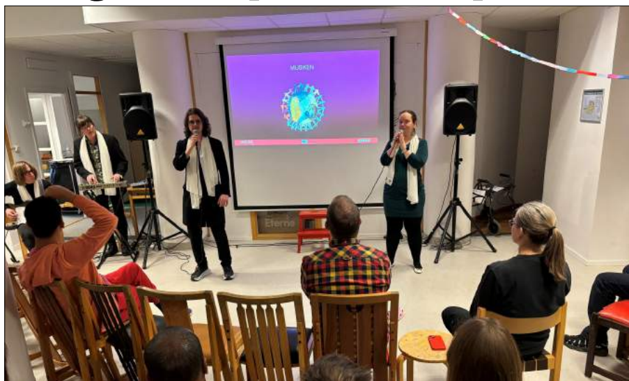
Vi fick lyssna på många fina låtar.